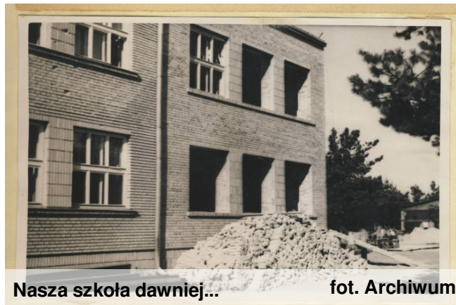
Nasza szkoła dawniej...

A. Ż.: Każda reforma jakoś tam wpływa. Jeśli chodzi o wyposażenie szkoły, to Pani Dyrektor dostała dużo pieniędzy i jak widzicie, jest wiele nowych, przydatnych pomocy, szkoła została rozbudowana. I to są plusey.