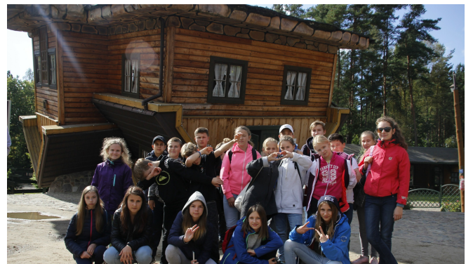
Wycieczka do Szymbarku