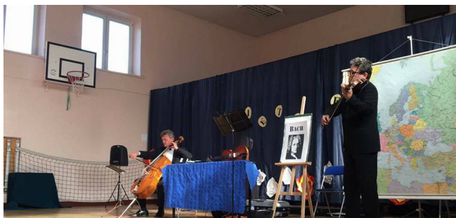
Koncert muzyki poważnej