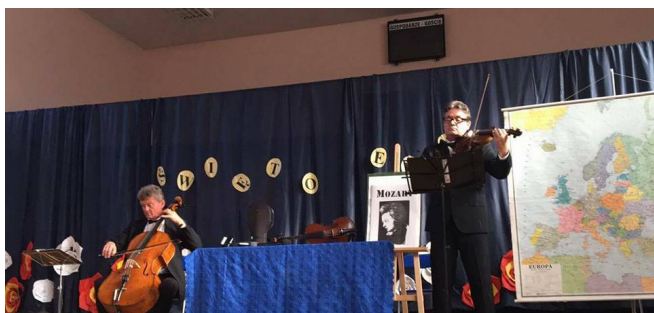
Koncert muzyki poważnej