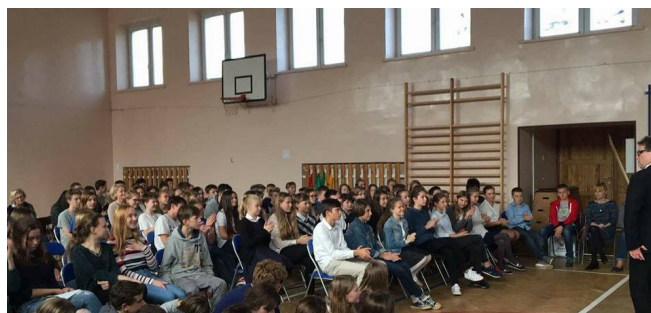
Koncert muzyki poważnej