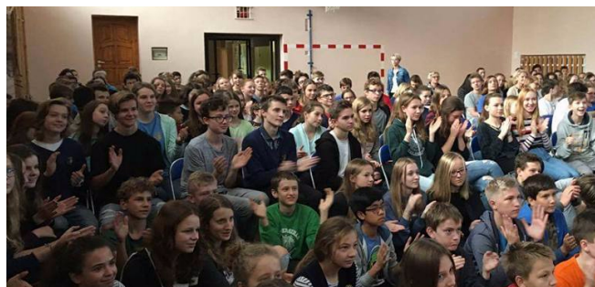
Koncert muzyki poważnej