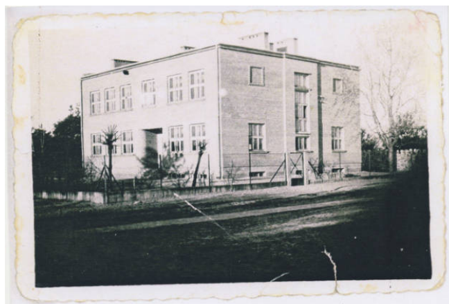
Szkola w 1948 roku

Wadą chyba jest to, że pracujemy w systemie klasowo – lekcyjnym. Marzy mi się, żeby uczyć młodzież kompleksowo. Na przykład raz w tygodniu wychodzić razem, nawet tu do radościńskiego lasu z nauczycielem chemii, fizyki, biologii, geografii i uczyć się o zjawiskach, które możemy obserwować tu, na miejscu. >> str. 7