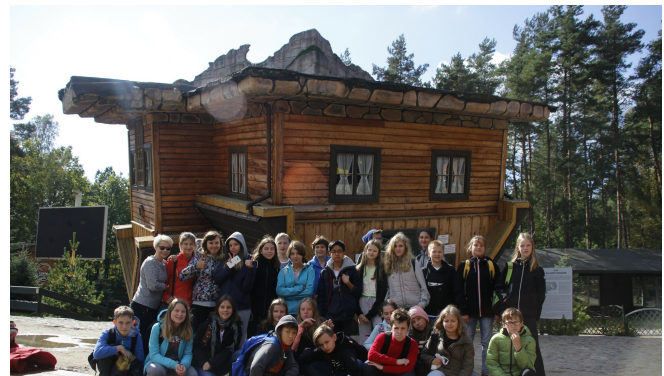
Wycieczka do Szymbarku

No cóż, nie zapomnę nocy filmowej, którą zaplanowaliśmy z kolegą. Mieliśmy oglądać „Skazanych na Shawshank”. Niestety, bardzo szybko zostaliśmy zdekonspirowani, mimo że próbowaliśmy się ratować. Nie pomogła ucieczka balkonem. Zakończyło się nocnymi rozmowami dydaktycznymi – z nauczycielem i rodzicami (tymi ostatnimi na szczęście telefonicznie). Mimo to będę bardzo dobrze wspominał. Stałem się sławny.